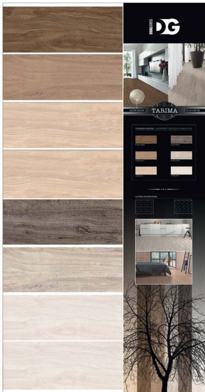
D15_103 · PANEL TARIMA