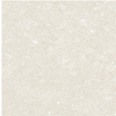
Pav.Rockland Marfil 45 x 45 CM