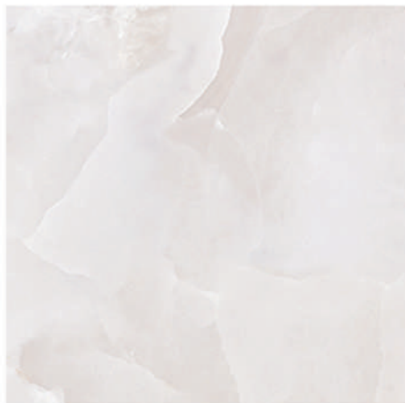
Pav. Queen Pearl