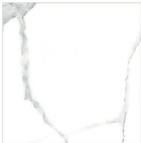
Palmira Pav. Blanco