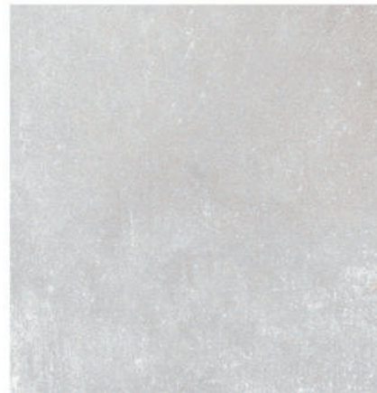
Palace Pav. Grey 45 x 45 CM