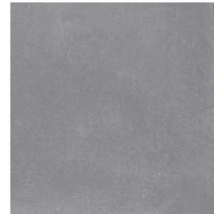
Palace Pav. Graphite 45 x 45 CM