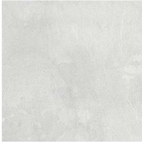
Pav. Monestir 45 x 45 CM GT1