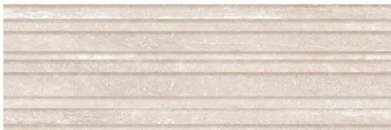
Blind Mistral 32 x 96 CM