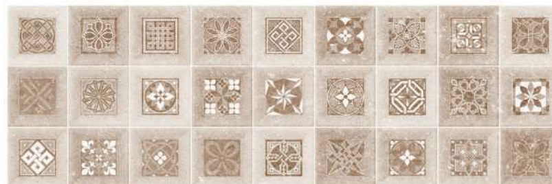
Frame Gregal 32 x 96 CM