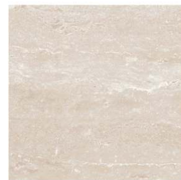
Pav Mistral 45 x 45 CM