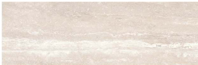
Mistral 32 x 96 CM