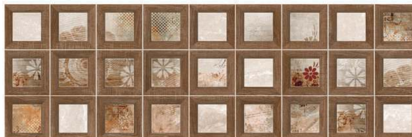
Frame Mistral 32 x 96 CM