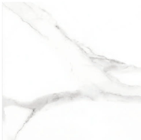
Pav. Kyra 45 x 45 CM GT1