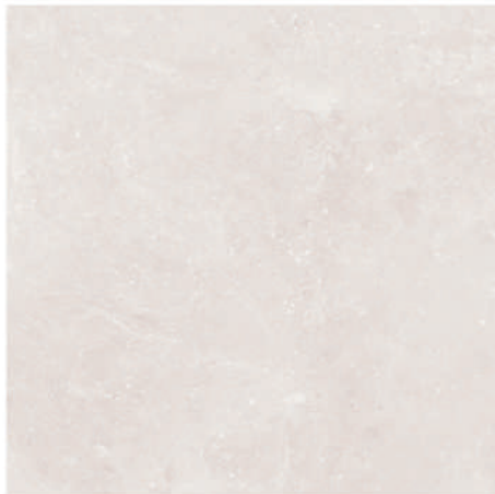
Pav Estepona 45 x 45 CM