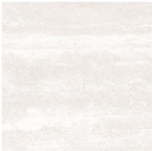
Pav. Coliseo Ivory