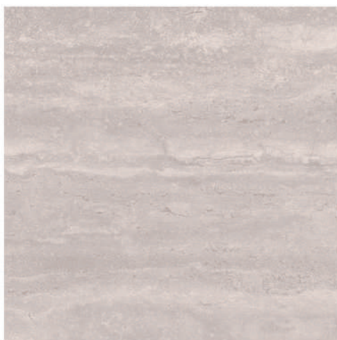
Pav. Coliseo Silver