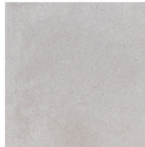
Pav. Civic Piedra 45 x 45 CM GT1