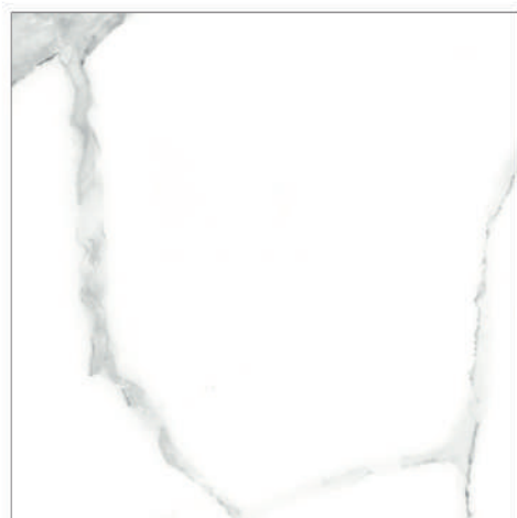
Pav. Beret 45 x 45 CM