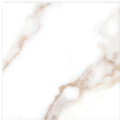
Pav. Aneu 45 x 45 CM